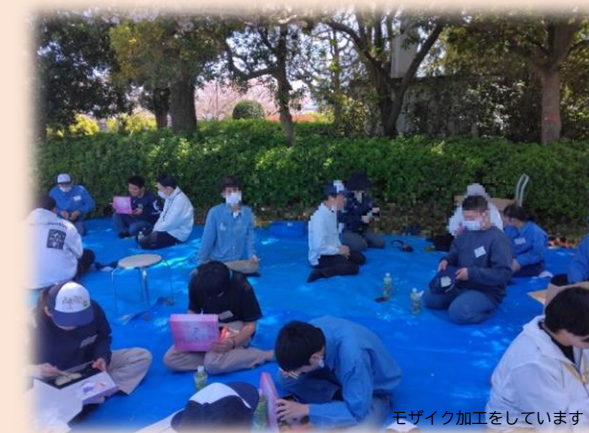
モザイク加工をしています