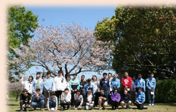
モザイク加工をしています