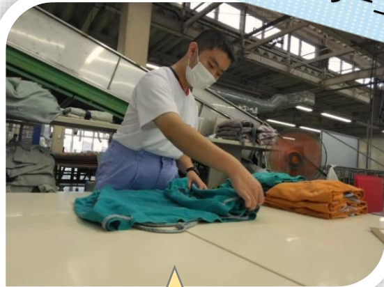
クリーニング工場での実習