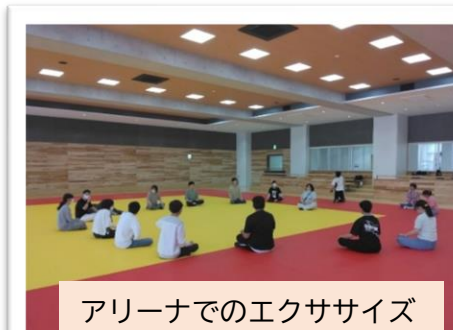
アリーナでのエクササイズ