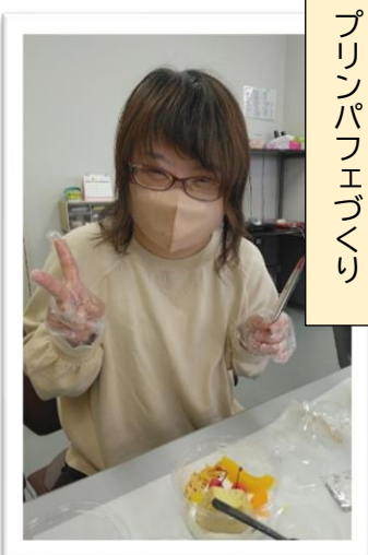
プリンパフェづくり