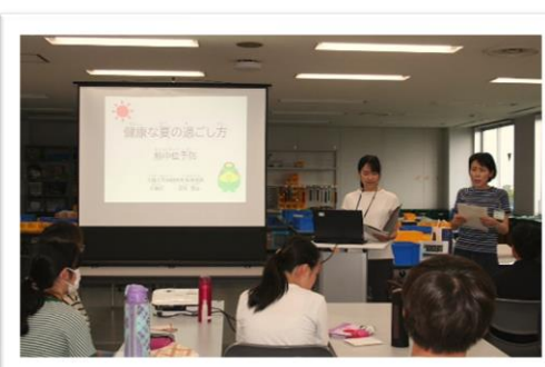
保健師さんによる熱中症講座