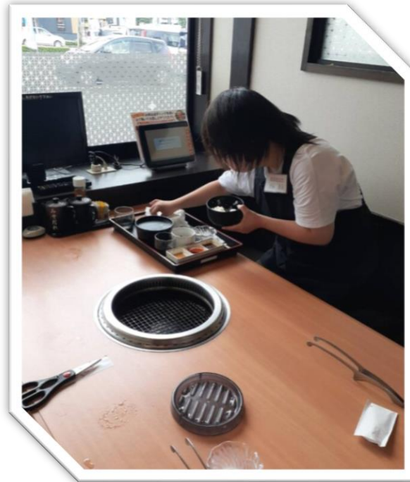
飲食店でバッシング（下膳）中です