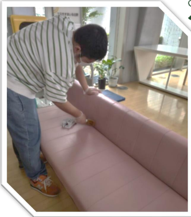
スポーツ施設で椅子をきれいに消毒しています