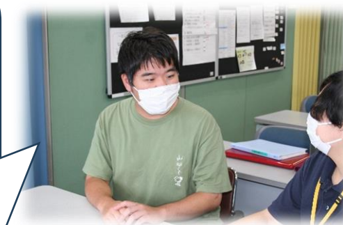
担当スタッフとはよく面談をします

訓練に行くようになって、苦手意識のあった“人との会話”が上手になったと思います。作業や実習を通して、自分の得意・不得意もわかるようになりました。また、できることが増えたことで自信がつき、以前より就職に対する不安が小さくなりました。今は、働きたいと思える会社に出逢うことができたので、そこで就職できるよう頑張りたいと思っています。