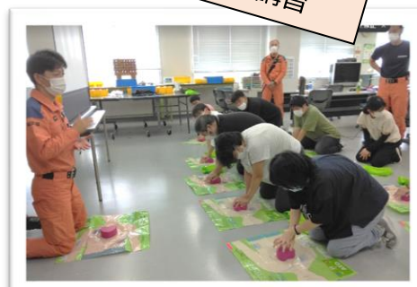
消防士さんによる 防災・AED講習