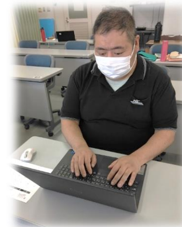
作業に集中できる時間も伸びました

以前、クローズで就職しましたが、注意されることが多く、働くことが怖くなっていました。相談機関と一緒に、あゆむを見学、体験して訓練に行くことに決めましたが、初めは馴染めるのか、体力は大丈夫だろうか？と不安がありました。